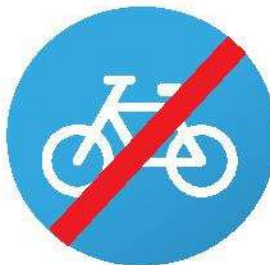
Конец велосипедной дорожки